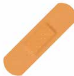
Curitas rectangulares y redondas