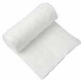
Algodón planchado y en bolitas