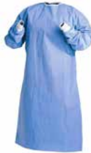
Batas manga larga / corta