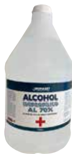
Alcohol isopropilico 24/4/8 Oz - 1/2 - 1 galón