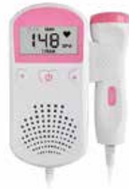
Monitor doppler fetal