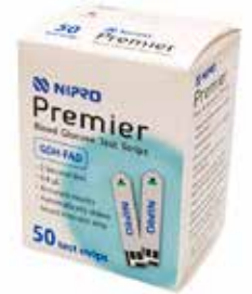
Tiras reactivas para glucosa