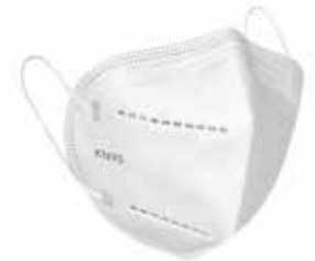
Mascarillas KN95 en blanco y negro