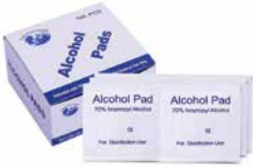
Pads de alcohol