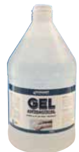
Alcohol en gel 1/2 - 1 galón