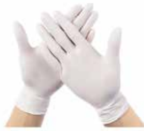
Guantes látex con y sin polvo