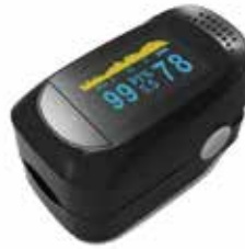
Oxímetro de pulso digital