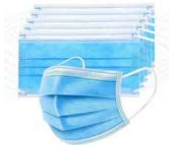
Mascarillas quirúrgicas en azul y blanco