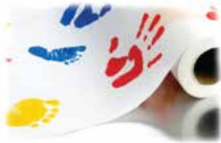
Papel camilla de muñequitos