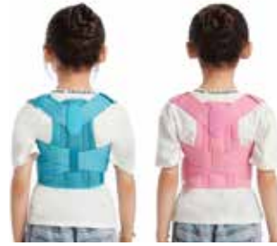
Corrector de postura para niños